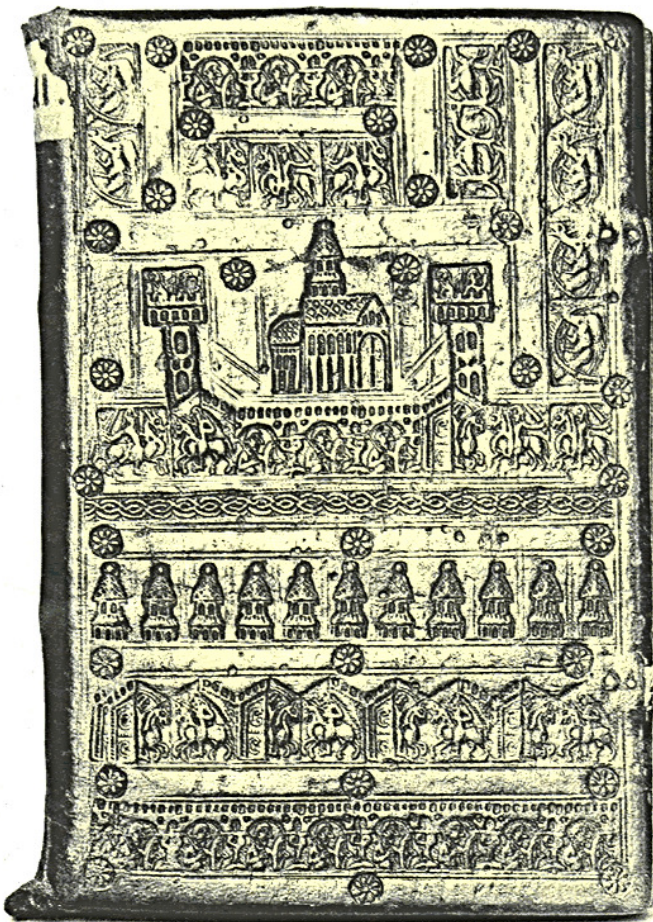
Vom Verkauf bedroht sind derzeit: das Evangelistarium aus St. Peter (um 1200; oben) und der romanische Pergamentcodex 242 von der Reichenau. Doch erst das Nebeneinander von prächtig illuminierten Handschriften und einfachen Textmanuskripten macht den Wert einer Bibliothek aus.

Das soll nun alles nicht mehr gelten. Bernhard von Baden hat plötzlich wieder Interesse an der dem Land überlassenen Bibliothek gefunden, nicht aber, um sich mit dem Kulturerbe seines Hauses zu identifizieren, sondern weil er sie als Verfügungsmasse in einem anrühigen