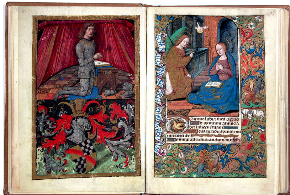
Stundenbuch des Markgrafen Christoph I. von Baden. Pergament. Paris?, Ende 15. Jahrhundert. Badische Landesbibliothek, Cod. Durlach 1, Blatt 18v und 19r.