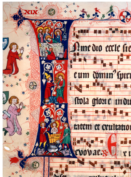
Graduale cisterciense (Wonnentaler Graduale). Pergament. Wonnental im Breisgau, um 1340–1350. Badische Landesbibliothek, Cod. Ü.H. 1, Blatt 19v. Ausschnitt.

Angesprochen wurde in dieser Stellungnahme des Ministeriums noch ein weiterer Diskussionspunkt zwischen dem Hause Baden und dem Land Baden-Württemberg: die Frage nach dem Eigentum vieler in badischem Museumsbesitz befindlicher Kunstgegenstände, auf die von Seiten des Hauses Baden, vertreten durch den Erbprinzen Prinz Bernhard, Eigentumsansprüche erhoben werden. Auf diese Frage eine eindeutige Antwort zu geben, ist nicht möglich. Zu kompliziert ist die Rechtslage, was unterschiedliche Rechtsgutachten, die in der Vergangenheit dazu in Auftrag gegeben worden waren, belegen. So war es in Baden