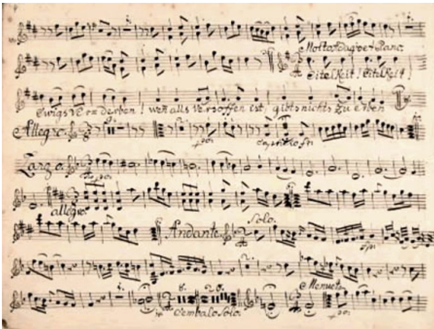
W. A. Mozart, "Galimathias musicum" (KV 32), Stimme der ersten Violine, Abschrift.

mich ihm oft zu schreiben, und so höchst vergnügt unser Aufenthalt war, so sehr traurig war unser Abschied."