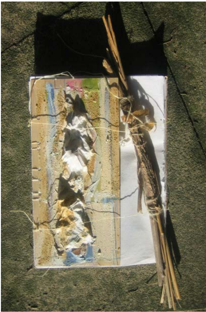
Unikatbücher – Buchobjekte von PHILINE Kempf