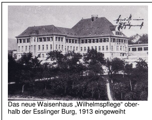
Das neue Waisenhaus „Wilhelmspflge“ oberhalb der Esslinger Burg, 1913 eingeweiht

In dem 1913 fertig gestellten Neubau des Israelitischen Waisenhauses Wilhelmspflge in der Mülbergerstraße 146 stand für die Andachten, Gottesdienste und Feiern ein würdig eingerichteter Betsaal zur Verfügung. In ihm befanden sich ein Toraschrein mit drei Tora-Rollen und vom Vorbeterpult bis zum Ewigen Licht alle in einer Synagoge gebräuchlichen Einrichtungsgegenstände. Jungen und Mädchen saßen auf Bänken voneinander getrennt. Für die musikalische Gestaltung der Andachten und Gottes-