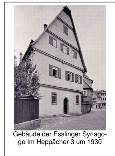
Gebäude der Esslinger Synagoge Im Heppächer 3 um 1930

1818 wurde der israelitischen Gemeinde ihr bisheriger Betsaal gekündigt, was sie zunächst in große Bedrängnis brachte. Glücklicherweise konnte man Anfang 1819 ein zweistöckiges mittelalterliches Gebäude Im Heppächer erwerben, das ehemalige Zunfthaus der Schneider. Der Umbau dieses Hauses zu einem jüdischen Gemeindezentrum mit Betsaal, Unterrichtsraum, Vorbeterwohnung wurde bis September 1819 abgeschlossen. Viele Jahre lang hatte die Gemeinde die Schulden für diesen – ihre finanziellen Möglichkeiten fast übersteigenden - Hauserwerb abzuführen. Doch hat sich der Betsaal in diesem Gebäude bewährt: fast 120 Jahre wurden in ihm die Gottesdienste der Gemeinde gefeiert.