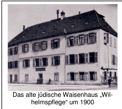
Das alte jüdische Waisenhaus „Wilhelmspflge“ um 1900

Im Sommer 1841 konnte der von allen jüdischen Gemeinden Württembergs unterstützte „Verein zur Versorgung armer israelitischer Waisen und verwaarloster Kinder“ in Esslingen am Entengraben ein Haus erwerben, um darin eine Waisenhaus einzurichten, das in den folgenden Jahrzehnten einen hervorragenden Ruf unter den Wohltätigkeitseinrichtungen Württembergs bekommen sollte: das israelitische Waisenhaus „Wilhelmspflge“. Das religiöse Leben in diesem Haus spielte eine große Rolle, dennoch war aus Platzmangel zunächst kein separater Betsaal vorhanden; die