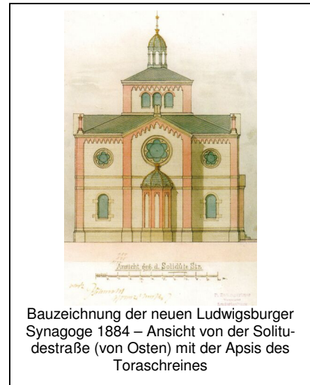
Bauzeichnung der neuen Ludwigsburger Synagoge 1884 – Ansicht von der Solitudestraße (von Osten) mit der Apsis des Toraschreines