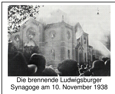
Die brennende Ludwigsburger Synagoge am 10. November 1938