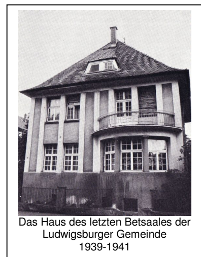
Das Haus des letzten Betsaales der Ludwigsburger Gemeinde 1939-1941