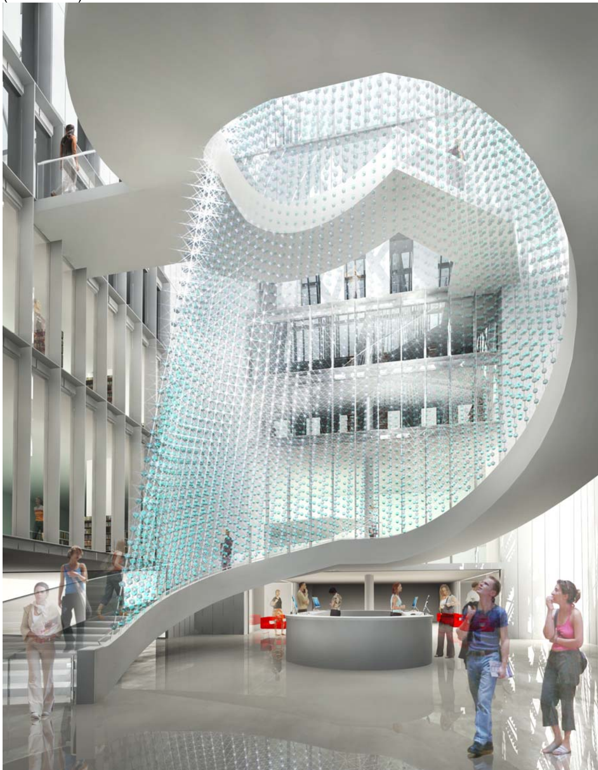
Futur hall d'accueil sous le dôme et escalier monumental desservant les différents plateaux dédiés au public.

environ 350 000 ouvrages et par la réalisation d'espaces d'exposition et de conférences (auditorium).