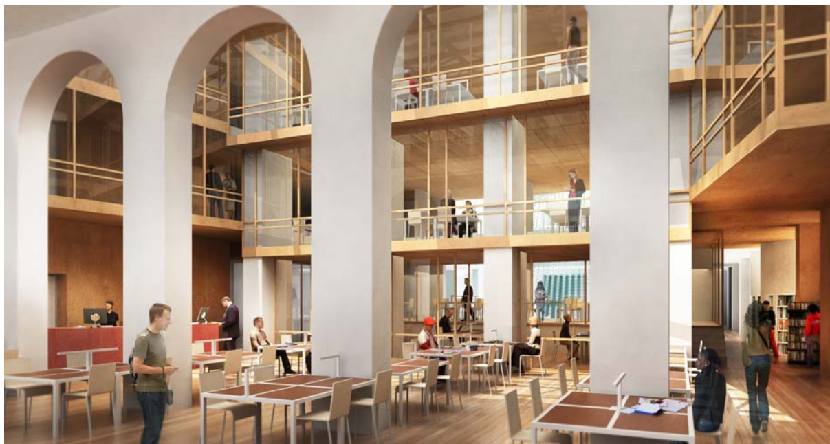
Future salle de lecture avec mezzanines en encorbellement.