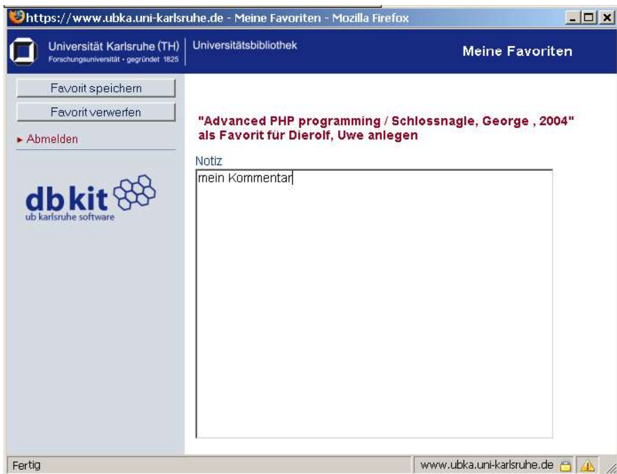
Abb. 4.3: Favorit mit Kommentar ablegen

Schon seit langem äußerten Bibliothekskunden den Wunsch, eigene Rechercheergebnisse kommentieren und eigenständig verwalten zu können. Dies wurde durch die Ergebnisse des DFG-Projekts ermöglicht. In kurzer Zeit konnte eine Favoritenverwaltung in den Uni-Katalog integriert werden.