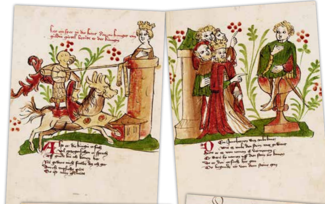
Blatt 31r: Am Artushof angekommen setzt sich Wigalois nichtahnend auf den Tugendstein. Auf dem Bild sieht er aus wie ein Designersessel, der Text beschreibt ihn als gläsernen Quader. Da nur jemand ohne Makel den Stein berühren kann, erregt Wigalois die Aufmerksamkeit der Hofgesellschaft um König Artus.