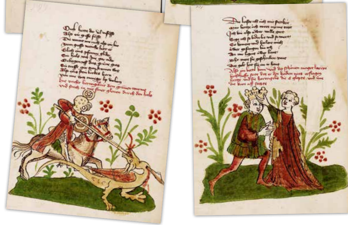
Im Verlauf der Handlung nimmt die Bebilderung immer stärker ab. Blatt 170v illustriert Heirat und Krönung des Titelhelden, zeigt aber von dem pompösen Fest mit Gästen aus aller Welt nur die Szene, in der Larie Wigalois die Krone Korntins aufsetzt. Das letzte Fünftel der Dichtung ist unebildet.