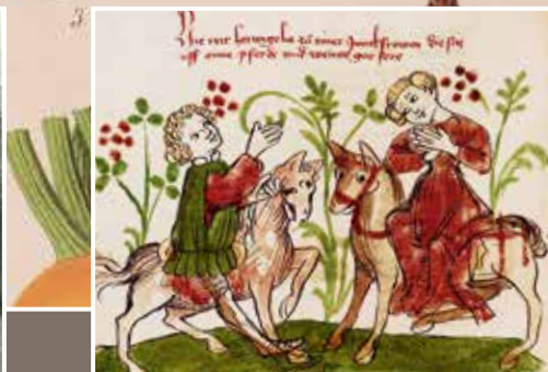
HANDSCHRIFTENKAUF – Artusritter Wigalois ist zurück