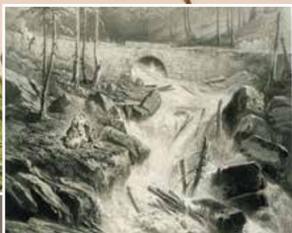
SCHWARZWALDTOURISMUS – Landpartien und Reiselust