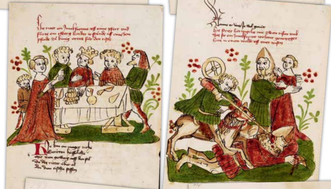
Blatt 43v: Der unerfahrene Wigalois muss sich anschließend in zahlreichen Abenteuern beweisen. Unter anderem bewahrt er eine Jungfrau vor der Vergewaltigung durch zwei Riesen indem er den einen ersticht und den anderen verwundet - dank des Glücksrades an seinem Helm.